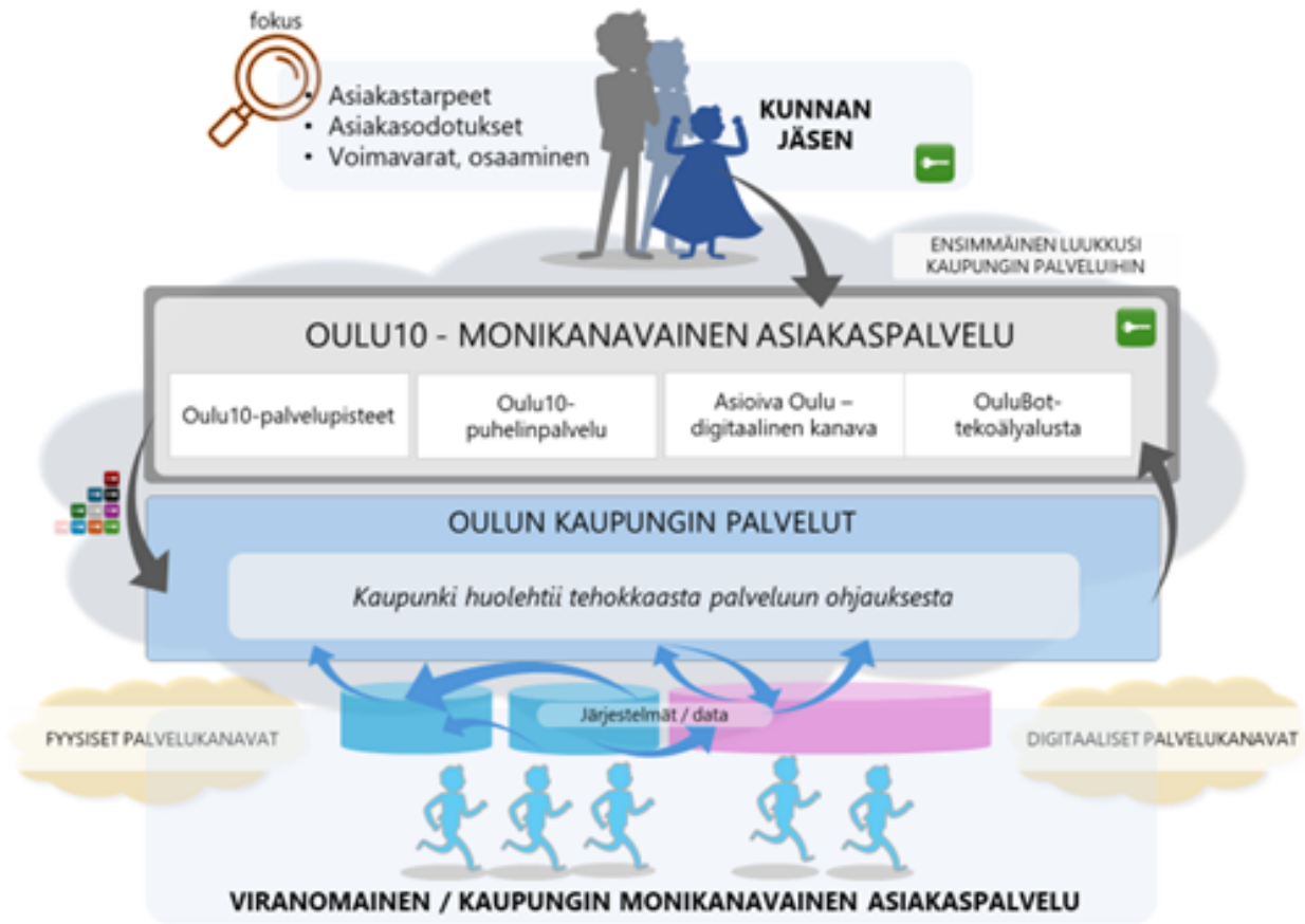
TAVOITE: Ensimmäisen luukun –periaate Kehityksen yhteinen fokuksipiste kunnan jäsentä palvelevasti